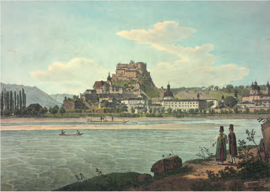
Jakob Alt Die Stadt Salzburg vom Ufer der Salzach aus gesehen , 1833 Lithografie