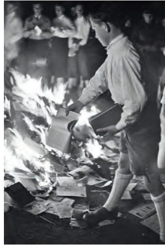
Franz Krieger, Bücherverbrennung am Residenz- platz, 30. April 1938, Salzburg

diffamiert, Bücher aus Literatur und Wissenschaft wurden öffentlich verbrannt. In der Stadt Salzburg wurde mit der Bücherverbrennung am Residenzplatz 1938 ein Kapitel der Kunst geschrieben, das wir nur als antimodern und den modernen Künsten gegenüber als generell feindlich bezeichnen können. Wie kann nach dieser Erfahrung und in einer Gesellschaft, in der viele mit einem noch in keiner Weise aufgearbeiteten Verschulden an einem unvergleichbaren Genozid belastet waren, ein Neubeginn gestartet werden? Wie kann der Verlust jener Menschen, mit einer modernen Lebensauffassung, von kritischem Intellekt und mit hohem Wissen ausgestattet, zumindest in einem geringem Ausmaß wieder aufgeholt werden? Das sind die Fragestellungen, mit denen sich die Gesellschaft auf der ganzen Welt, insbesondere in Österreich und Deutschland nach dem Zweiten Weltkrieg und bis heute auseinanderzusetzen hat.