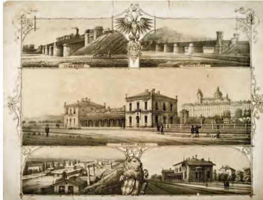
Bahnhöfe und Brückenanlagen der Kaiserin Elisabeth-Bahn, 1860 Lithografie Ansicht aus dem Album zur Eröffnung der Strecke Wien-Salzburg (Westbahn)