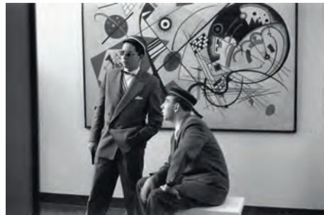
documenta 1, 1955 Plakat