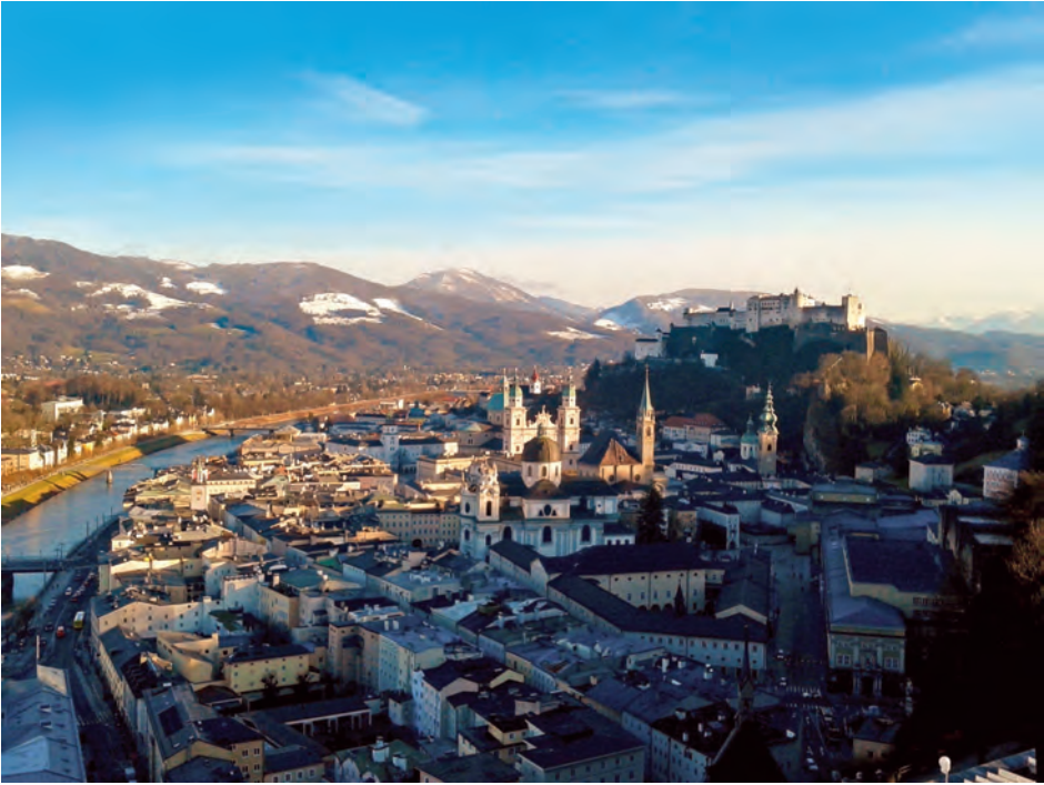
Stadt Salzburg, 2016