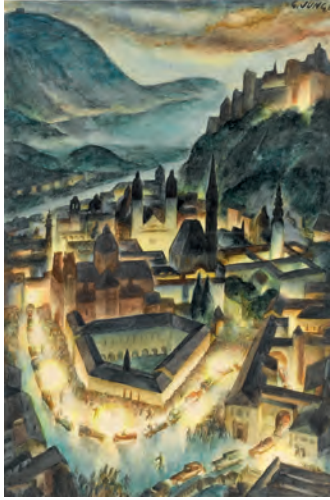
Georg Jung Die Festspielauffahrt, 1929 Aquarell auf Papier Privatsammlung