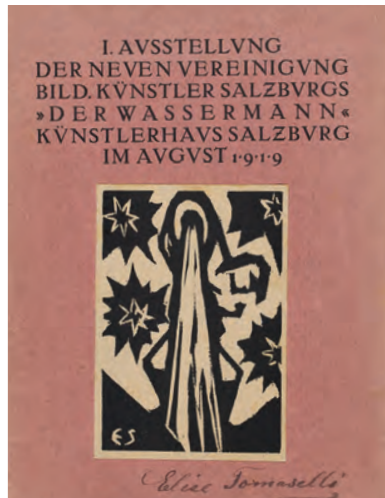
Salzburger Festspiele, 1921 Plakat